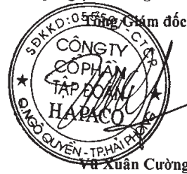
Vũ Xuân Cường