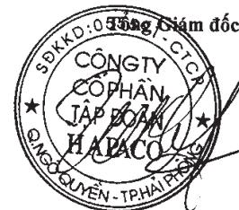
Vũ Xuân Cường